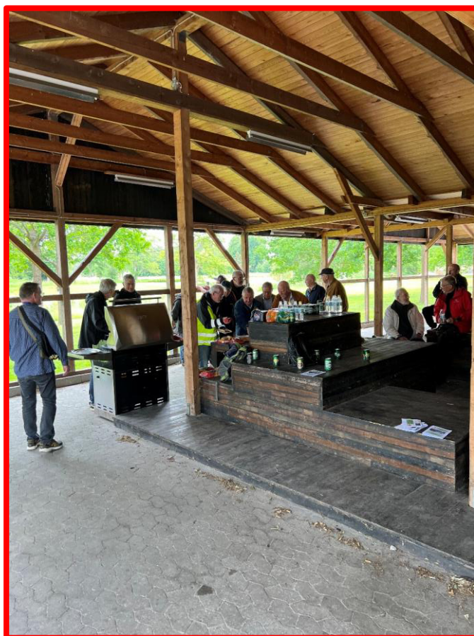
Grill-party i juli i uge 24, i forbindelse med Mænds Sundhedsuge.